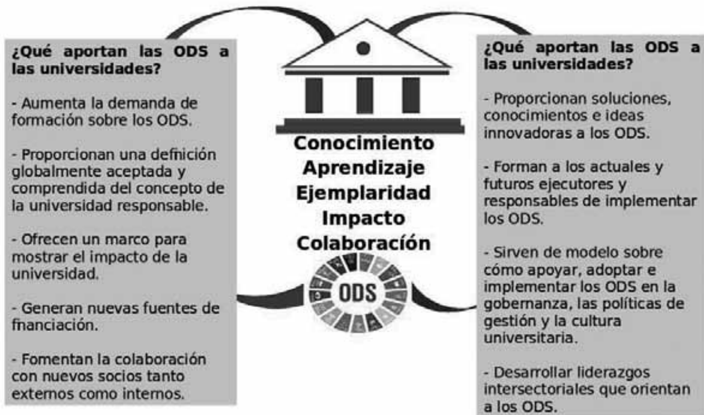
Figura N° 3. Contribución de las universidades a los ODS y viceversa