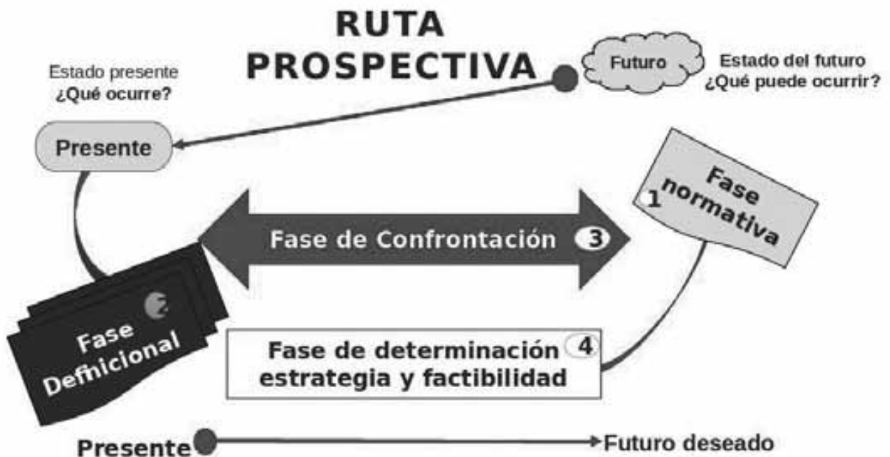
Figura N° 1. Ruta prospectiva