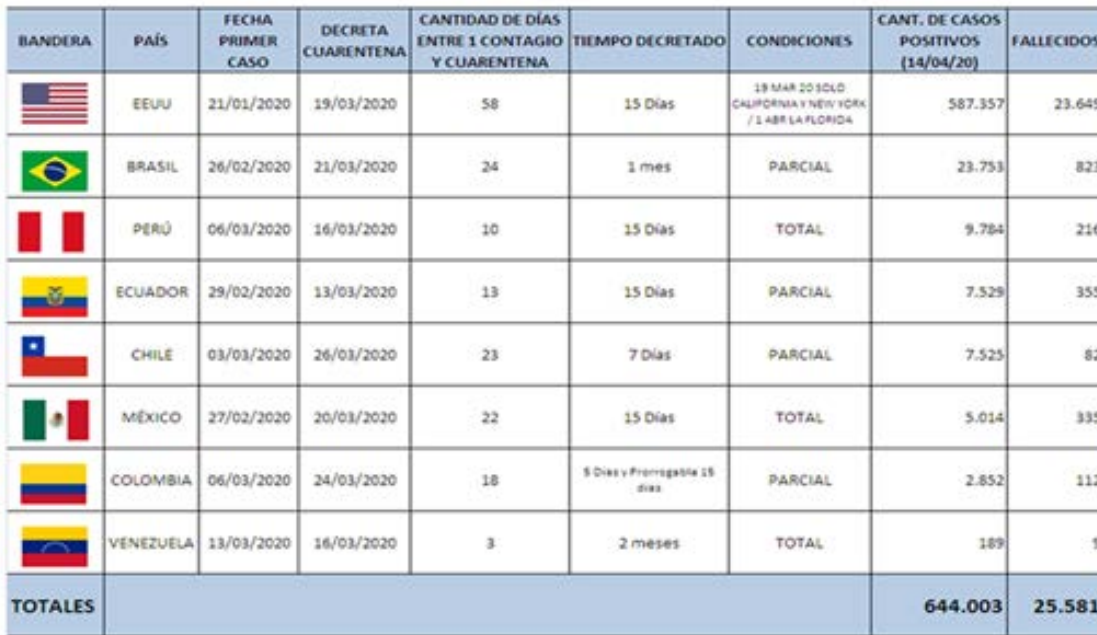
Figura 3. Tiempo de aplicación de la cuarentena en países seleccionados