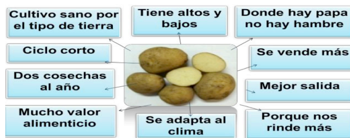
Figura 1. Características relevantes del cultivo de papa para los productores de la zona.

La participación y discusión conjunta, permitió determinar que la papa representa el primer rubro, con el 45% de los votos, seguido de la zanahoria, con 30%, y el apio, con el 25%. La importancia del cultivo seleccionado, utilizando la técnica de la araña, mostró que la papa representa la principal hortaliza que se siembra en Marajabú. La Figura 1 muestra las principales características de la papa, en cuanto al manejo, cultivo, producción, alimentación, comercialización, tiempo de cosecha, entre otras cualidades que hacen del cultivo el más rendidor e importante para la comunidad.