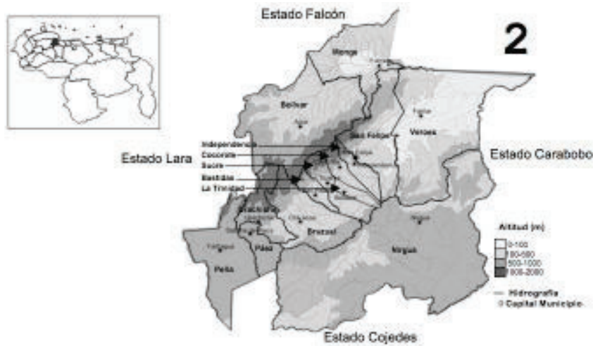
Figura 1. Ubicación geográfica, relieve e hidrografía del estado Yaracuy y sus municipios

superficie de 0,28 millones de hectáreas agrícolas y dividido políticamente en 14 municipios (Figura 1). Predominan las unidades de paisaje montañoso, que junto con el piedemonte de colinas, representan el 65% de su territorio. El clima de la entidad, de acuerdo a la Clasificación Climática de Köeppen es de sabana (Aw) y de estepa (Bs) con una temperatura media anual entre 20° y 26° C y precipitación media de 1.900 mm anuales. La actividad económica predominante es la agricultura. Destacan rubros como el maíz, el cambur, la caraota, la caña de azúcar, el café, el sorgo, el plátano, el aguacate, la naranja y otras frutas. En el sector pecuario sobresalen la ganadería de bovinos, porcinos y aves. La entidad, en términos económicos, produce bienes y servicios con mayor intensidad para los estados vecinos que para su circulación interna (Ferrer y De Paz, 1985).